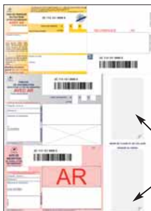
Modèle avec Avis de Réception et codes barres.

Avec ou sans AVIS de RECEPTION / Avec ou sans CODE BARRE