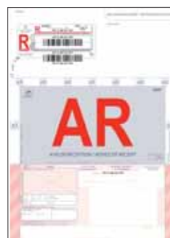
Modèle avec Avis de Réception et codes barres.

* 3 recommandés par feuille, boîte de 750 recommandés.